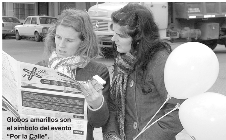
Globos amarillos son el símbolo del evento “Por la Calle”.

La experiencia se inició el año pasado en Buenos Aires y Rosario donde participaron más de 45 dise-